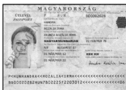
Magyar biometrikus útlevél

A modern kor azonosítási procedúrája automatizálódik, berendezések és szoftverek végzik a beérkezett és a tárolt információk összevetését, nem pedig a határőr vagy rendőr ellenőrzi a fotót és a személyt. Ezzel együtt 2012-re már több százezer hamis biometrikus útlevél került forgalomba az EU-ban, és több százezer olyan, amelynek az ujjlenyomat mintája értékelhetetlen. Főleg gyermekek és idősek ujjlenyomatai bizonyultak megbízhatatlannak, de az EP már végzi a biometrikus útlevetek felülvizsgálatát.