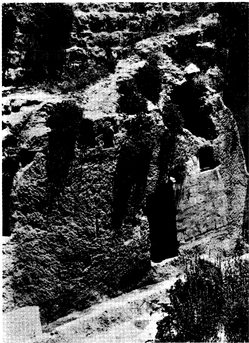
Egy kerti sírhely, a Golgota hegyének közvetlen közelében – lehet, hogy Jézust pont ide temették el.