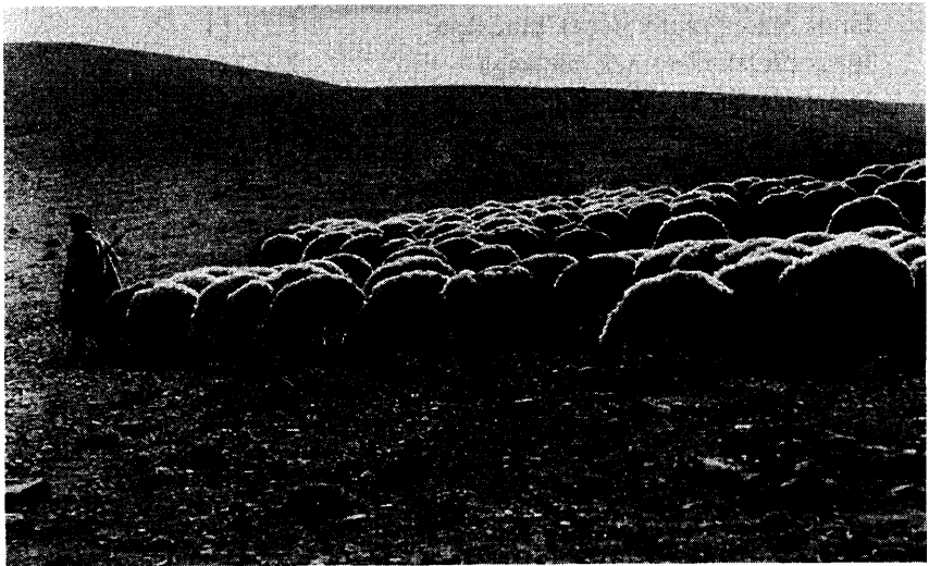
„...Előttük jár, és a juhok követik ...” – János evangéliuma 10:4. Juhász és juhok Palesztinában.

Ez a három szó: jelek, hinni, élet az evangélium logikus felépítését biztosítja. A jelekben Isten nyilatkozott meg, a hit a jelek által kiváltandó reakció, az élet pedig a hit eredménye.