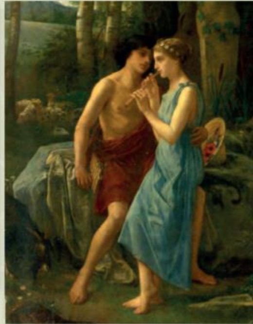
► Pierre Cabanel: Daphnis és Chloë, 1870