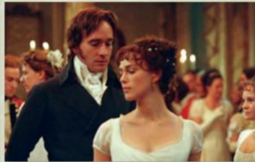
► Büszkeség és balítélet, r.: Joe Wright, 2005. Matthew Macfadyen és Keira Knightley