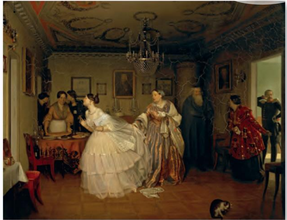
► Pavel Fedotov: Az őrnagy leánykérőben , 1848