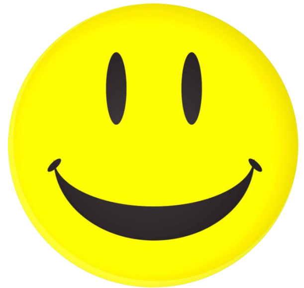
PNG (átlátszó háttér)