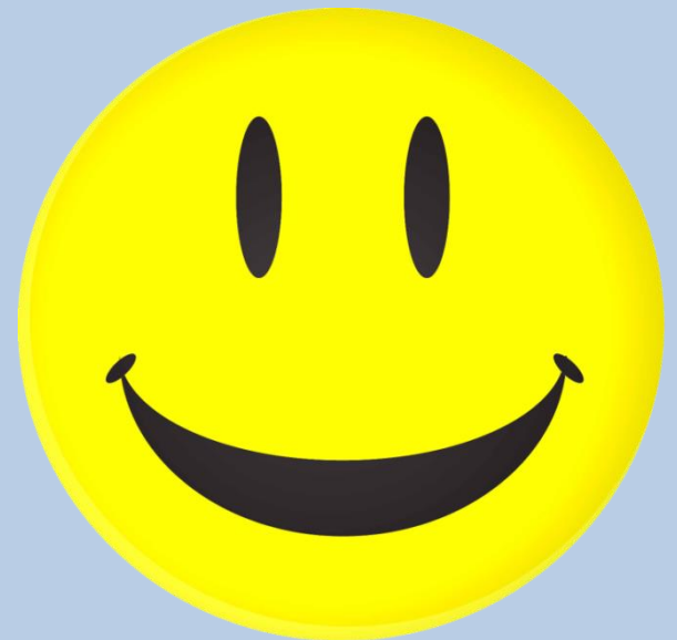
PNG (átlátszó háttér)