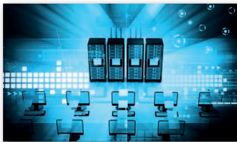
► Számítógépes hálózat

A másik típusba kevés, esetleg egyetlen gép tartozik az intézményben, ezeket szervernek – magyarul kiszolgálónak – nevezzük. A szerverek az iskolában általában legalább három feladatot látnak el. Mindeközben az iskolai számítógépes hálózaton kommunikálnak, „beszélgetnek” a kliensekkel és egymással, de ezen a hálózaton az ügyfelek közvetlenül is tudnak egymással kommunikálni.