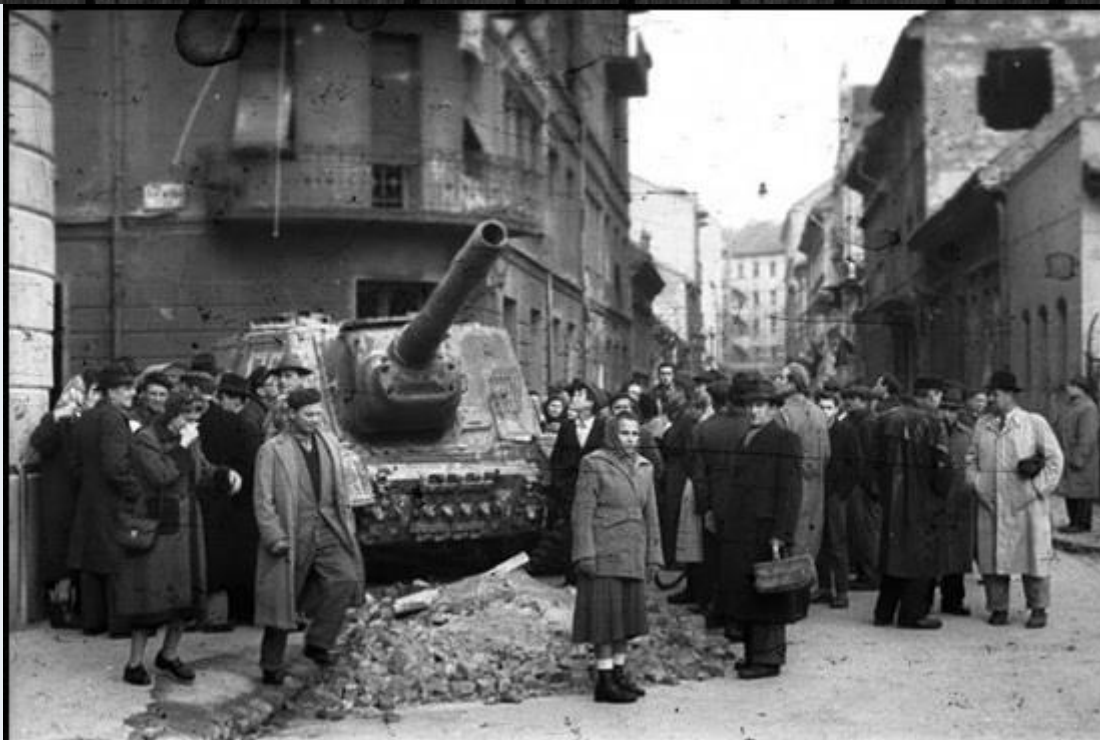
1956 -os forradalmi utcakép

A rádiónál folyó eseményekkel egy időben, de 1600 kilométerrel keletebbre, - Moszkvában - este 21-órakor Nyikita Hruscsov, két fontos döntést hozott! Egyrészt a Budapest környéki laktanyák harckocsijait a városba rendelte, másrészt utasítást adott átmeneti időnyerés céljából arra, hogy a magyar tömegek által követelt Nagy Imrét időlegesen miniszterelnökké nevezzék ki! A magyar pártvezetés így 1956 október 24-én reggel 8 órakor nyilvánosan is bejelentette a fontos eseményt. A forradalom második napja a harcok megindulását hozta, ugyanis a Hruscsov által küldött tankok reggelre megjelentek Budapest utcáin. A magyar felkelők azonban szembeszálltak velük, és a laktanyákból szereztve fegyvert, illetve Molotov koktélokot készítve, megindították a szabadságharcot.