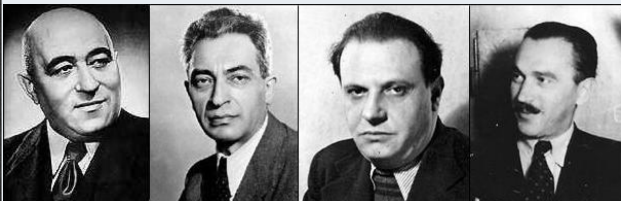
1956 előtt Magyarország teljhatalmú urai: Rákosi Mátyás, Gerő Ernő, Farkas Mihály és Péter Gábor

Az 1956-os forradalmat megelőző hét esztendő leggyűlöltebb kommunista diktátora Rákosi Mátyás volt. 1956 júliusában bekövetkezett bukása - vagyis az oroszok által történő leváltása és Szovjetunióba költöztetése - átmenetileg csillapította ugyan a lakosság elkeseredését, de mivel a helyére „bűntársa” Gerő Ernő került, a lakosság hangulata alig változott Magyarországon. Az embereknek elege volt az ÁVH korlátlan hatalmából, a diktatórikus kormányzásból, a koncepciók perekből az esztelen és logikátlan gazdaságirányításból illetve az alacsony életszínvonalért felelős kommunista vezetésből. Az elkeseredés és düh nyomán, 1956 őszén küszöbön állt a forradalom Magyarországon . A megmozdulásoknak három jelentős előzménye volt! Először is Losonczy Géza, a Petőfi-kört szervező újságíró nyíltan kritizálta Gerő Ernőt a Magyar Nemzetben. A cikk egyértelműen jelezte a formálódó magyar ellenzék tettvágását, melyet tovább serkentett a Magyar Írók Szövetsége is, mely 1956 szeptemberében nyíltan követelte Nagy Imre visszatérését.