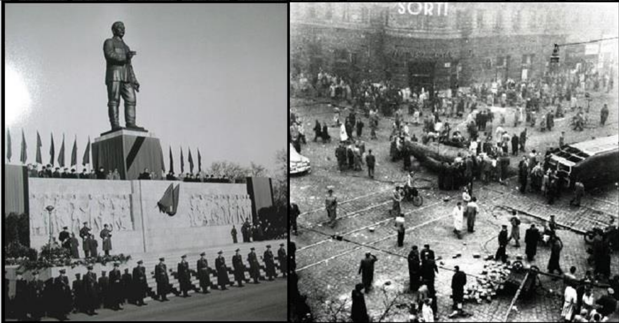
A Sztáin szobor fénykorában és ledöntve 1956 -ban

A Bródi Sándor utcában található rádió azért volt a forradalmárok fontos célpontja, mert a 16 pont közzé tétele szempontjából kulcskérdés lett elfoglalása. A rádiónál a katonák egy része váratlanul átállt, így először úgy tűnt áldozatok nélkül is megszerezhető lesz az épület. Ám ekkor az ÁVH emberei az ablakokból tüzet nyitottak a forradalmárokra, és így a szabadságharc később hosszúra nyúló áldozati listáján megjelentek az első hősi halottak nevei. Az épület mindezek ellenére hajnalra az ostromlók kezébe került, majd a rádiót átköltöztették a Parlamentbe. Az események fontos fordulóponthoz közeledtek, mert a Szovjetunió - a kétpólusú világrend egyik szuperhatalma - és a kelet-európai térség valódi ura megelégette a magyarországi folyamatokat! Lényeges és sorsfordító változásokra készült, melyek már túlmutattak határainkon és - bár ezt akkor még senki nem tudhatta - világpolitikai jelentőségű történések gyújtópontjaivá vált Magyarország. A további események meghatározó kulcsfigurája Nyikita Szergejevics Hruscsov, a donyecki szénbányászból pártvezérré vált ukrán kommunista lett, aki Sztálin halála, vagyis 1953 óta vezette a Szovjetuniót (és ezzel az egész kelet-európai térséget).