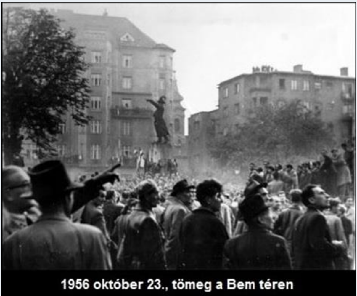
1956 október 23., tömeg a Bem téren

A forradalom és szabadságharc 1956 október 23-án kezdődött! A pártvezetés ugyan hosszú vita után végül engedélyezte a lengyel szimpátiatüntetést, ám elkéstek az engedményekkel. A nagy napon három fontos forradalmi központ alakult ki. Az első maga a Bem tér volt, ugyanis a diákok a Műegyetemtől a Duna parton vonultak oda, egyre növekvő számú tömeggé gyarapodva. Másik csoport előbb a Petőfi szobornál meghallgatta Sinkovits Imre szavaltát , a Nemzeti dalt, illetve a forradalom 16 pontos követelés listáját, majd ezt követően vonultak a Bem térre. Itt megszületett a forradalom jelképe, a közepén lyukas nemzeti zászló, melyből kivágták a népre